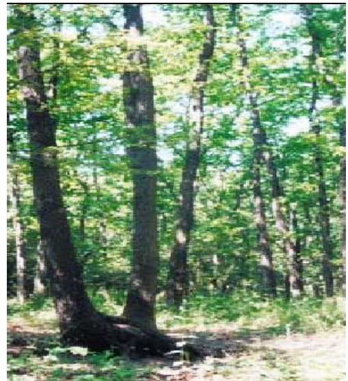
Fig. 4 Pădure danubian-balcanică de cer și gârniță cu Crocus flavus (după Doniță, et al. 2005 )

Compoziția floristică: Specii edificatoare: Quercus cerris , Q. frainetto , Fraxinus ornus , Carpinus orientalis . Specii caracteristice: Festuca heterophylla , Crocus flavus , Carex praecox . Alte specii importante: în flora vernală Scilla bifolia , în flora estivală Asparagus tenuifolius , Brachypodium sylvaticum , Carex caryophylla , C. spicata , C. tomentosa ,