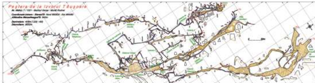
Harta peșterii de la de la Izvorul Tăușoarelor - proiecție în plan