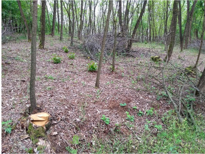
B02.02 Curățarea pădurii