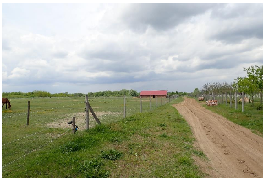
E01.01. Urbanizare continuă