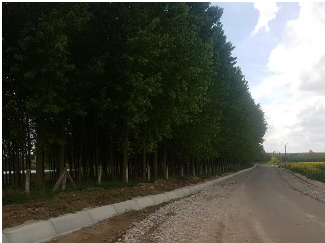
Figura 3 – Perdea forestieră de protecție din aria protejată (localitatea Galoșpetreu)