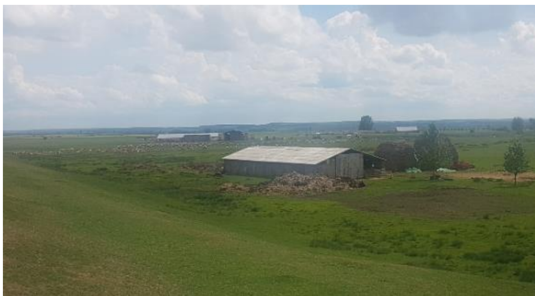
Figura 1 - Activități de creștere a oilor în perimetrul ariei protejate (localitatea Andrid)