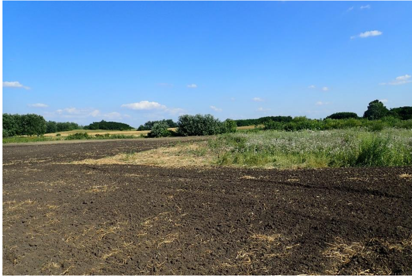
H01.05 Poluarea difuză a apelor de suprafață , cauzată de activități agricole și forestiere