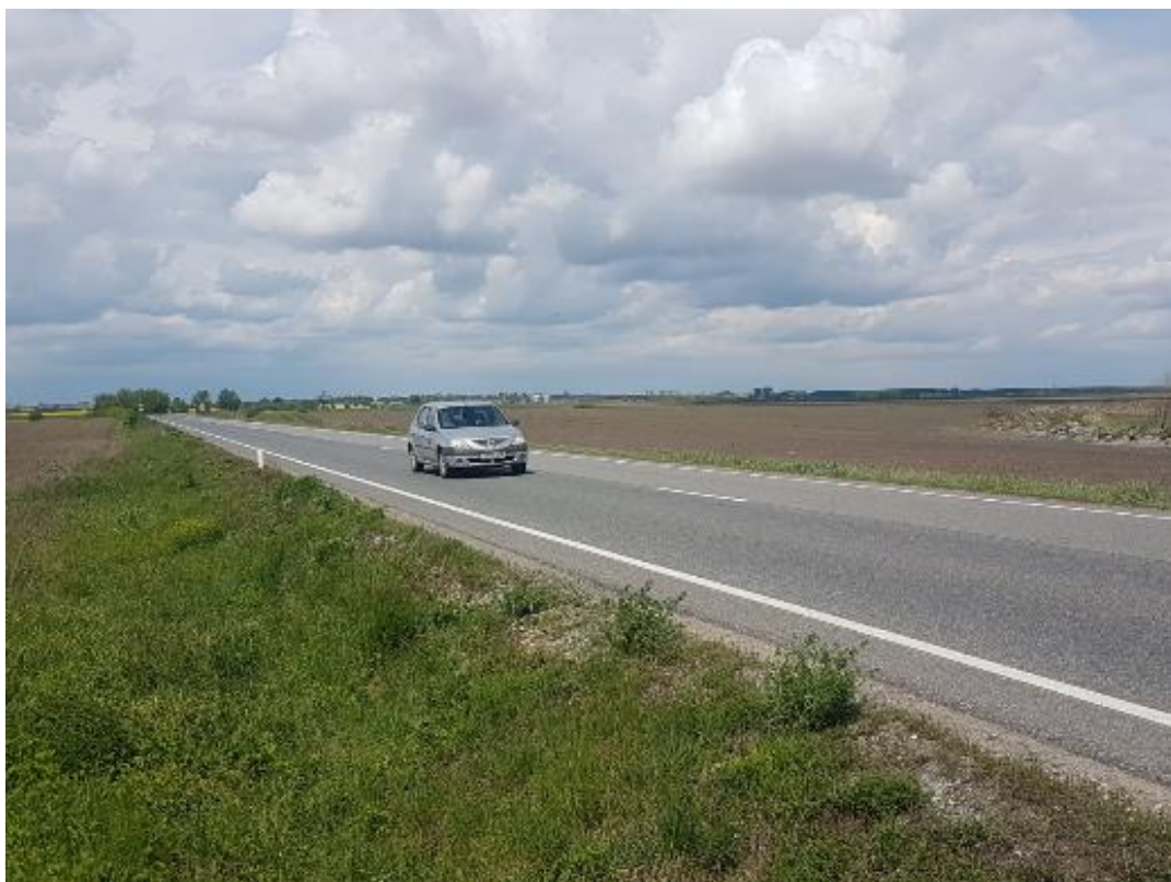
Figura 4 - Drumul european E671 (DN19), aflat în interiorul sitului (localitatea Tarcea)