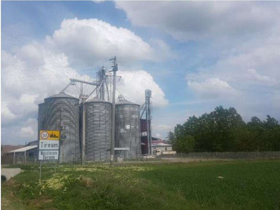
Figura 6 – Siloz pentru depozitarea recoltelor agricole (localitatea Tiream)