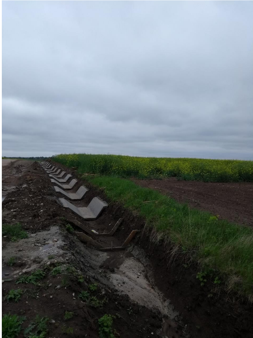
D01.02 Drumuri, autostrăzi