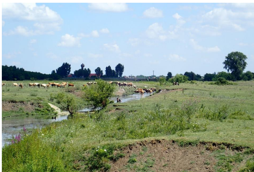
A04.02.01 Pășunatul ne-intensiv al vacilor