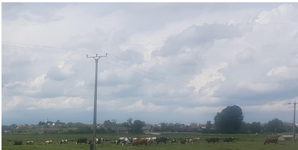
Figura 5 - Linie de electricitate ce intersectează situl în zona localității Andrid