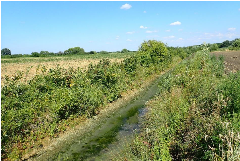
K01.03 Secare; K02.03 Eutrofizare