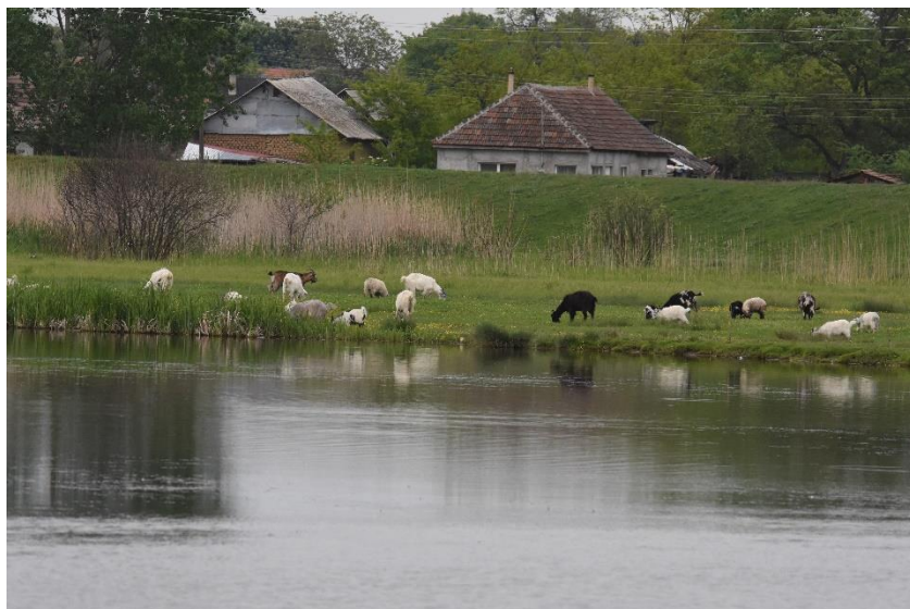
A04.02.02 Pășunatul ne-intensiv al oilor