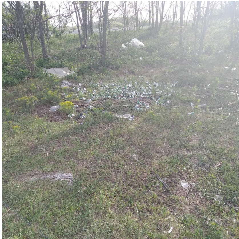
E.03.01 Depozitarea deșeurilor menajere