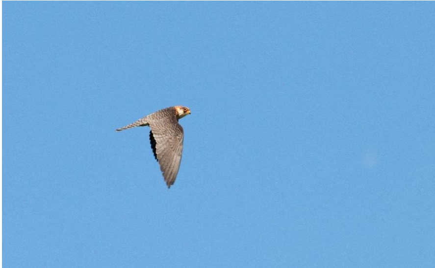
Falco vespertinus, femelă