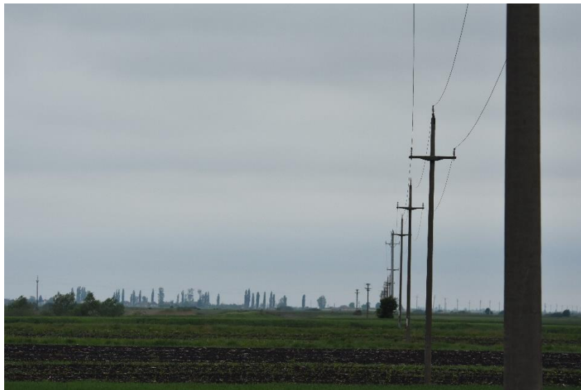
D02.01.01 Linii electrice și de telefon suspendate