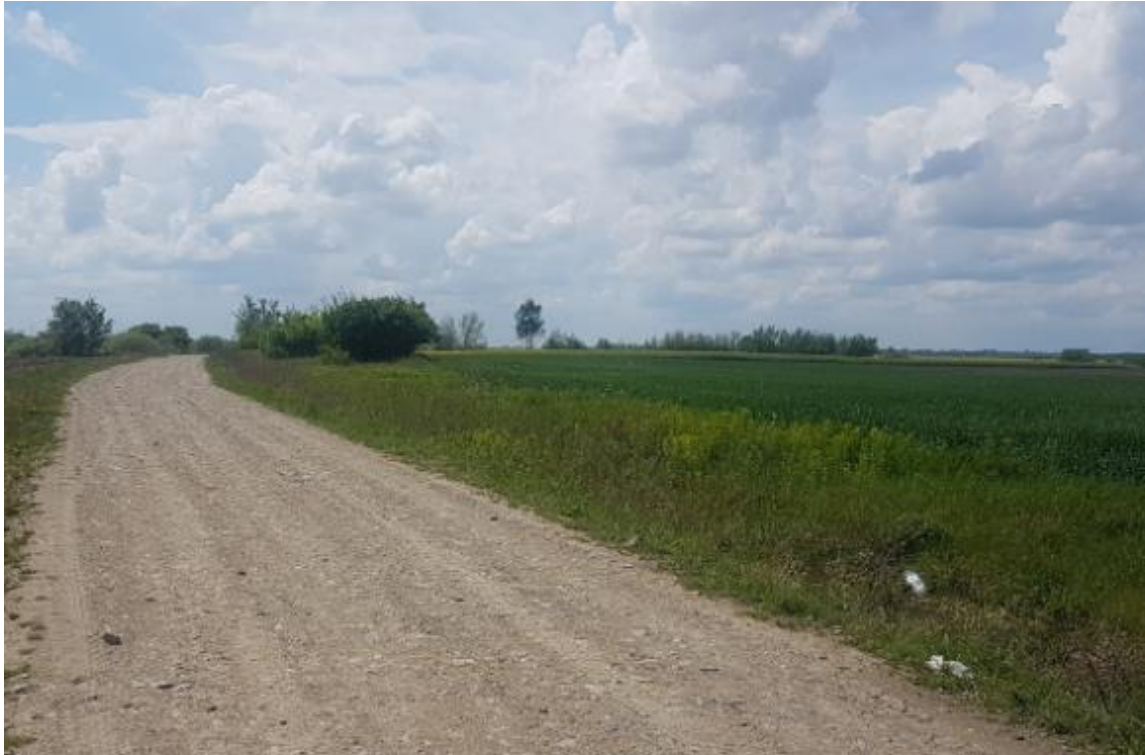
Figura 2 - Terenuri cultivate cu grâu în interiorul sitului (localitatea Galoșpetreu)